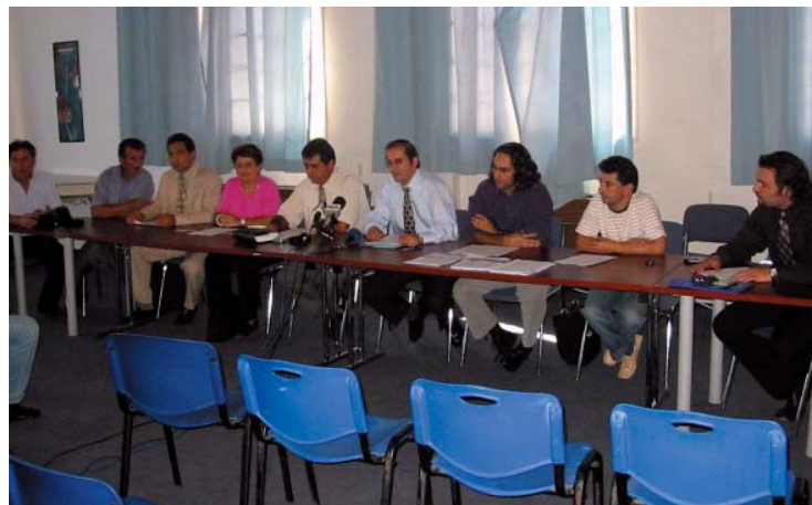
Συνέδριο ΕΤΥΕΕ για το Πλαίσιο Προσόντων στο Λουξεμβούργο, Δεκέμβριος 2005.

Ο κος Χριστόφιας μιλά στην εκδήλωση του Επαρχιακού γραφείου ΟΕΛΜΕΚ της Κερύνειας προς τιμή των Κερυνειωτών Εκπαιδευτικών που αφυπηρέτησαν.