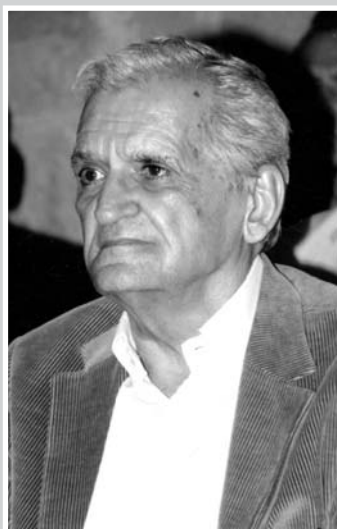
Ο ποιητής Τίτος Πατρικίου

Στιγμιότυπα από την εκδήλωση στις φωτογραφίες.