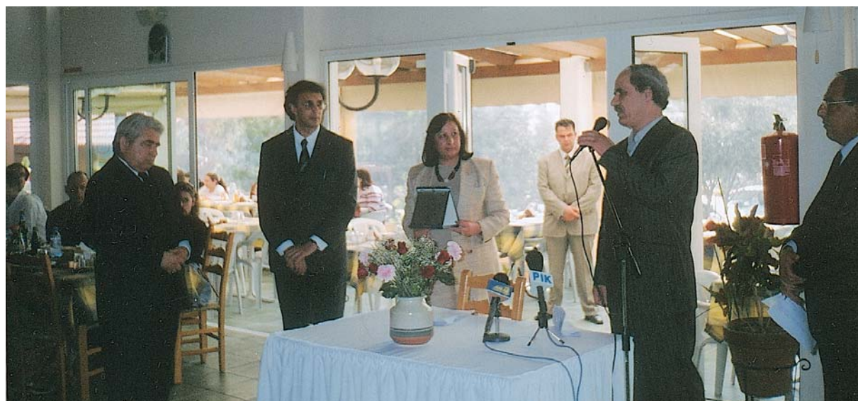
Ο Πρόεδρος της ΟΕΛΜΕΚ τιμά τον Πρόεδρο της Βουλής - Εκδήλωση Επαρχιακού ΟΕΛΜΕΚ της Κερύνειας, 9 Απριλίου 2006.