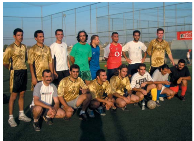
Εκδηλώσεις Ελληνοκυπρίων και Τουρκοκυπρίων Εκπαιδευτικών για την Παγκόσμια Μέρα Εκπαιδευτικού, 5 Οκτωβρίου 2005 Ποδοσφαιρικός Αγώνας Καθηγητών Vs Δασκάλων.