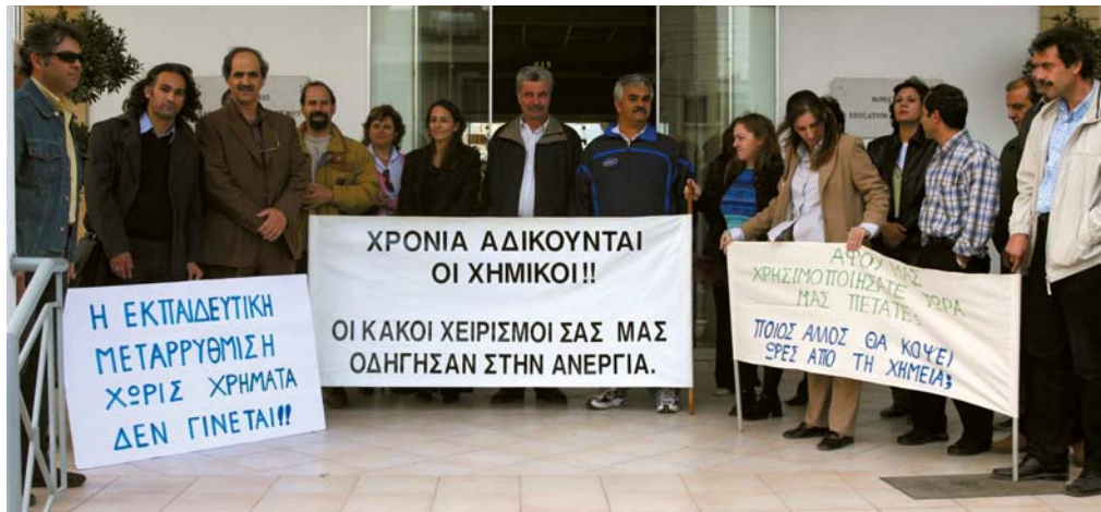
Εκδήλωση διαμαρτυρίας έξω από το Υπουργείο Παιδείας και Πολιτισμού για τους αδιορίστους Χημικούς, Νοέμβριος 2005.