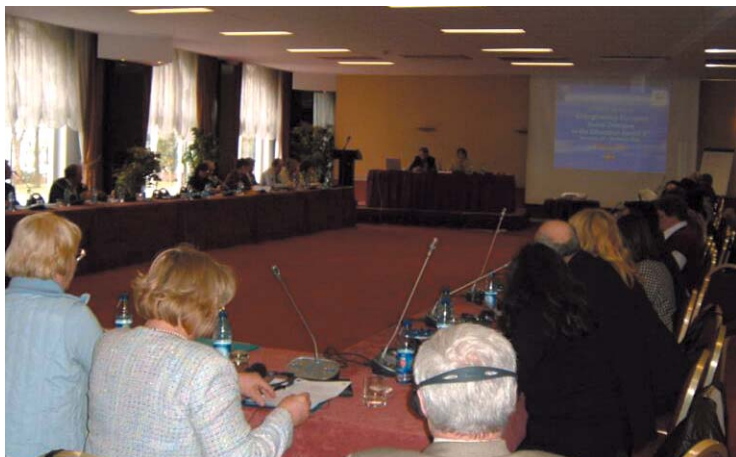
Συνέδριο ΕΤΥΣΕ για τον Κοινωνικό Διάλογο στην Εκπαίδευση στις Βρυξέλλες, Απρίλιος 2006.