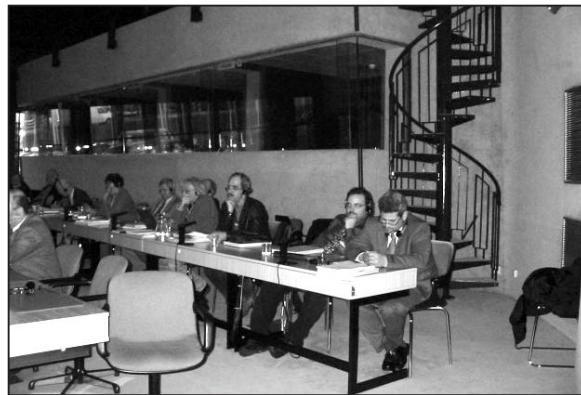
Εκδήλωση διαμαρτυρίας έξω από το Υπουργείο Παιδείας και Πολιτισμού για τους αδιόριστους χημικούς, Νοέμβριος 2005

Η ΟΕΛΜΕΚ συμμετέχει στις πιο πάνω δράσεις, πάντα σε συνεργασία και με τις υπόλοιπες εκπαιδευτικές οργανώσεις του τόπου, και σίγουρα έχει πολλά να επωφεληθεί αλλά και να προσφέρει μέσα από αυτή την συμμετοχή. Στην Ευρωπαϊκή Ένωση υπάρχει ένα παζλ εκπαιδευτικών συστημάτων και πρακτικών με αποτέλεσμα