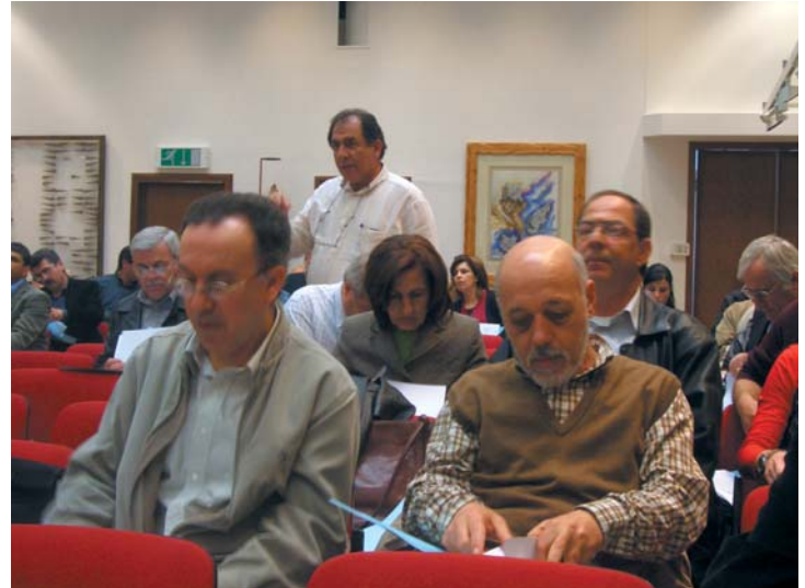
Δύο στιγμιότυπα από την Παγκύπρια Συνδιάσκεψη Γενικών Αντιπροσώπων, 2 Μαρτίου 2006.