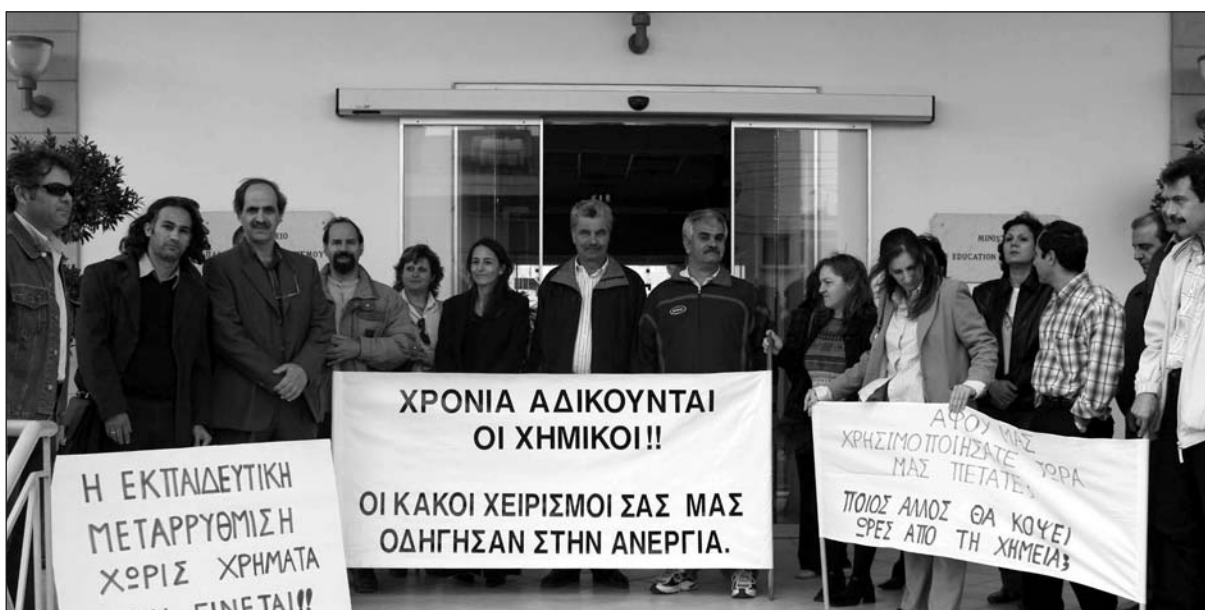
Επί των επάλλξεων

Στην προσπάθειά μας αυτή, σημαντική είναι και η δική σας βοήθεια και στήριξη. Είμαστε στη διάθεσή σας για ό,τι κι αν χρειαστεί και περιμένουμε με χαρά τα άρθρα σας.