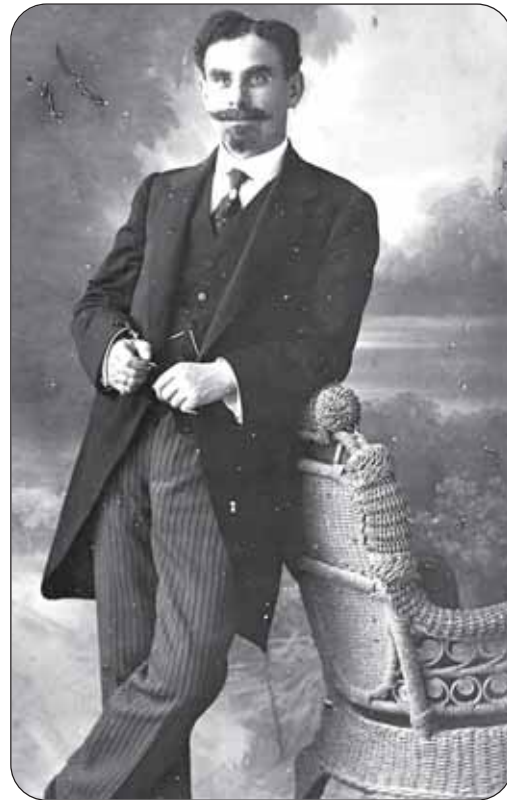
Ο Χριστόδουλος Σώζος στα πρώτα χρόνια της σταδιοδρομίας του ως δικηγόρος.

Την εισήγηση με θέμα «Η θέση του Χριστόδουλου Σώζου στην ιστορία του κυπριακού εθελοντισμού», παρουσίασε με αναφορά σε πηγές της εποχής και σε επιστολές συναγωνιστών και φίλων του ήρωα, ο κ. Πέτρος Παπαπολυβίου, Αναπληρωτής Καθηγητής στο Τμήμα Ιστορίας και Αρχαιολογίας του Πανεπιστημίου Κύπρου. Στο καταληκτικό του σχόλιο εξήρε τον πατριωτισμό και την αυταπάρνηση του ήρωα, αφού είχε αφήσει πίσω την οικογένειά του – και τον τετράχρονο γιο του – αλλά και τη θέση του ως δημάρχου και πολιτευτή για να καταταγεί ως απλός στρατιώτης σε μάχη μονάδα, ώστε να μεταβεί στην πρώτη γραμμή των μαχών. Σχετικά με την προσωπικότητά του ανέφερε πως «διέπρεψε ως πολιτευτής, ως βουλευτής εκλέχθηκε για δύο περιόδους, από το 1901 μέχρι το 1911, πάλεψε για την Ένωση στο Νομοθετικό Συμβούλιο όσο λίγοι, ήταν ρομαντικός, αλλά ήταν παράλληλα και πρακτικός, ήταν