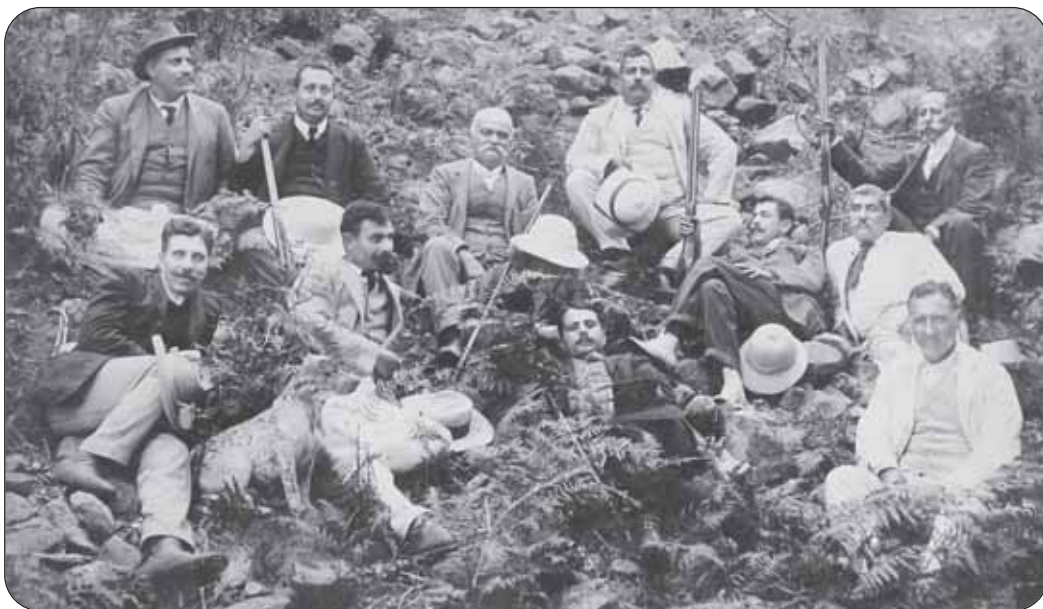
Για κινήγι στις Πλάτρες.