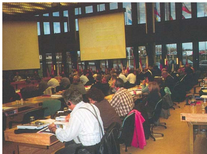
Τακτική Εκλογική Συνέλευση Ευρωπαϊκής Συνομοσπονδίας Εκπαιδευτικών Οργανώσεων - Rapeurorean - ETUCE Λουξεμβούργο 4-6 Δεκεμβρίου 2006.