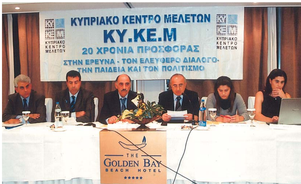
Ημερίδα ΚΥΚΕΜ 15/11/06. Θέμα: Κυπριακή Κοινωνία και Νεολαία: Προβλήματα-Παράμετροι-Ευθύνες-Απόψεις-Εισηγήσεις