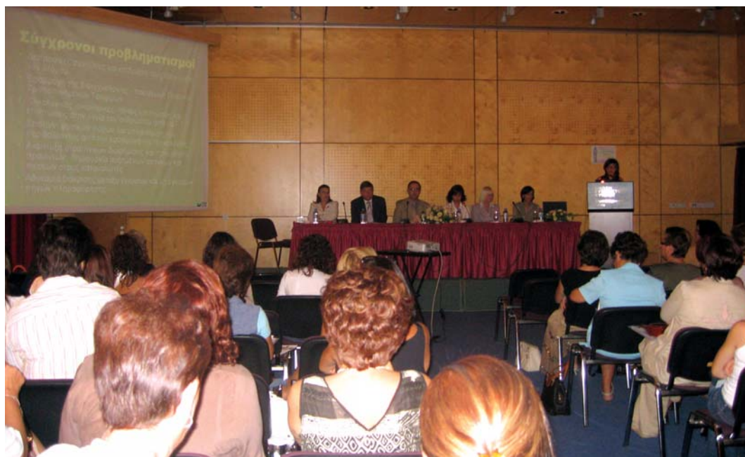
1ο Συνέδριο Οικογενειακής Αγωγής Οκτώβρης 2006

λο τον εκπαιδευτικό κόσμο ομένο το Νέο Έτος 2007