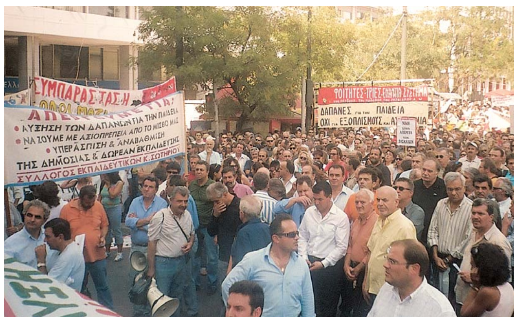
Πανεκπαιδευτικό Συλλαλητήριο - Αθήνα 2006.