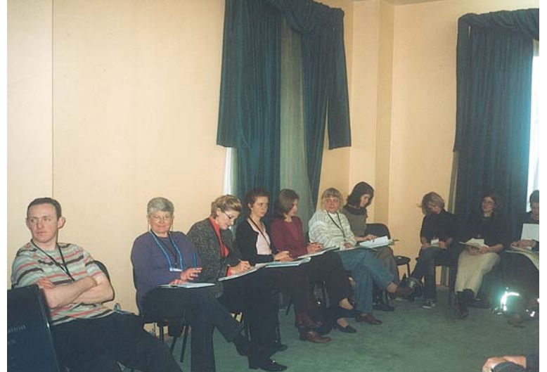
Συνέδριο Βορρά-Νότου. Λισσαβώνα 2007