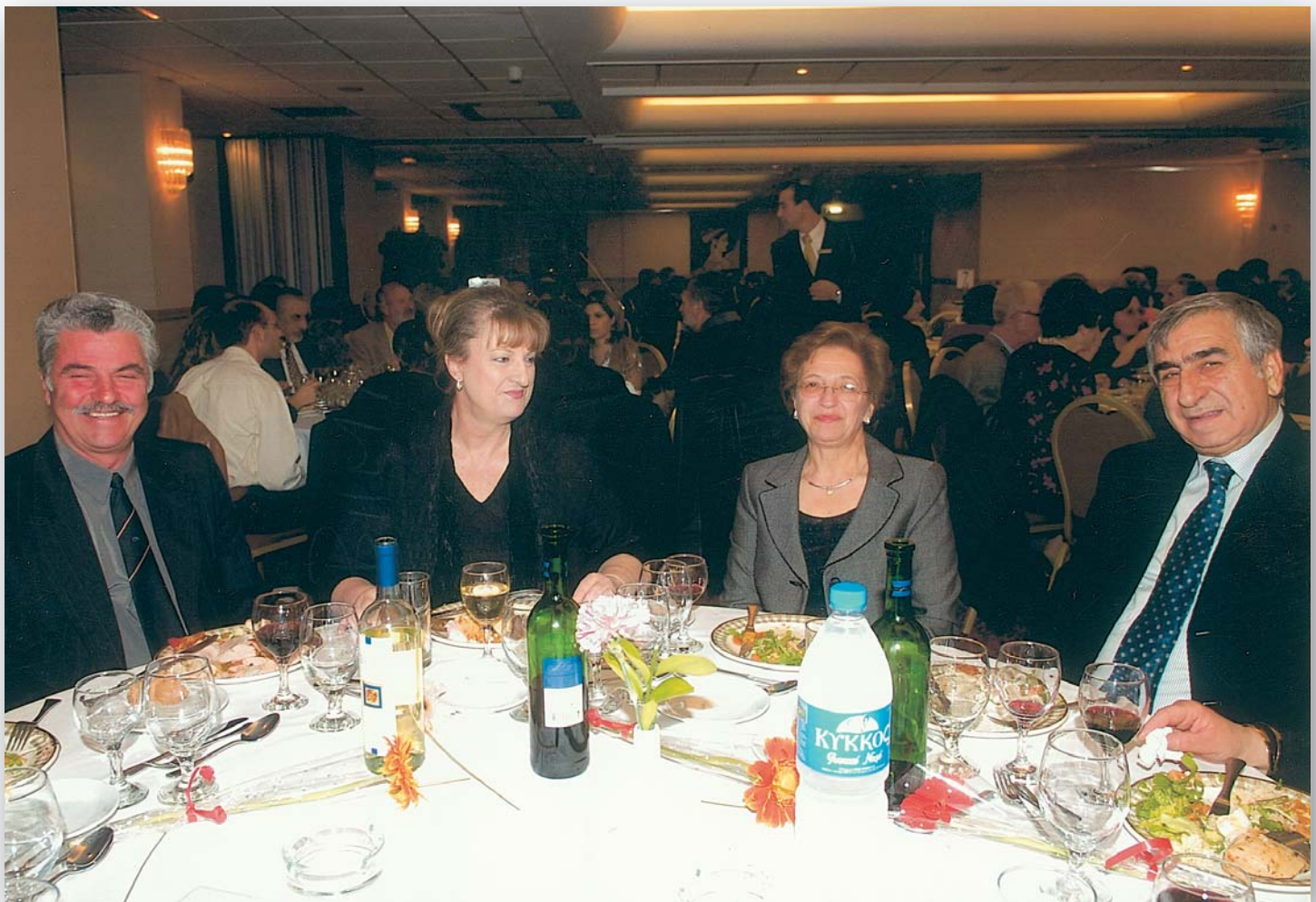
Στιγμές από το δείπνο προς τιμή των συναδέλφων που έχουν αφυπηρητήσει 7 Φεβρουαρίου 2007